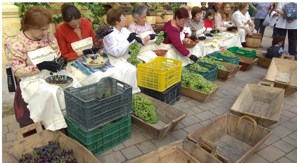
Jornadas de oficios tradicionales en Terque (Almería). Iniciativa del Museo Provincial de la Uva de Barco de Terque para el conocimiento y la difusión de la cultura parralera de la provincia de Almería (Jose Carlos Castaño Muñoz)