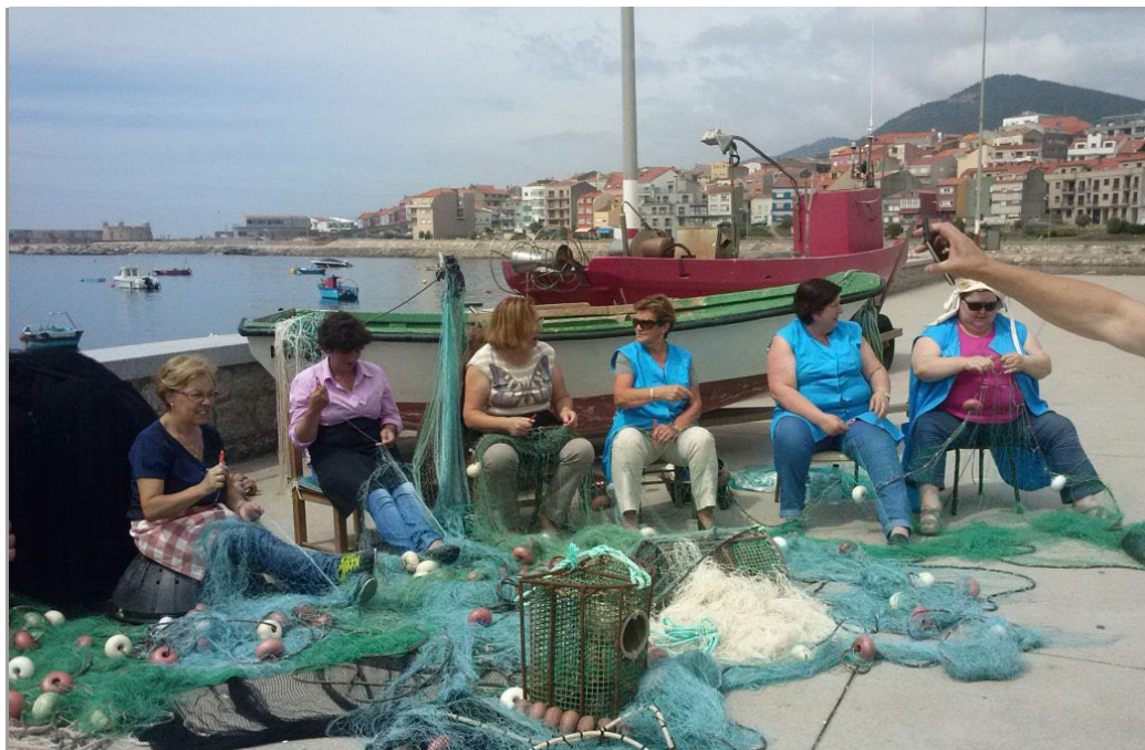
Asociación de Redeiras do Baixo Minho Atalaia (A Guarda. Pontevedra). Constituida para favorecer la profesionalización de la labor artesanal del cosido de redes, que durante años ha venido siendo desempeñada por las mujeres gallegas ( www.redeirasdeg Galicia.org )