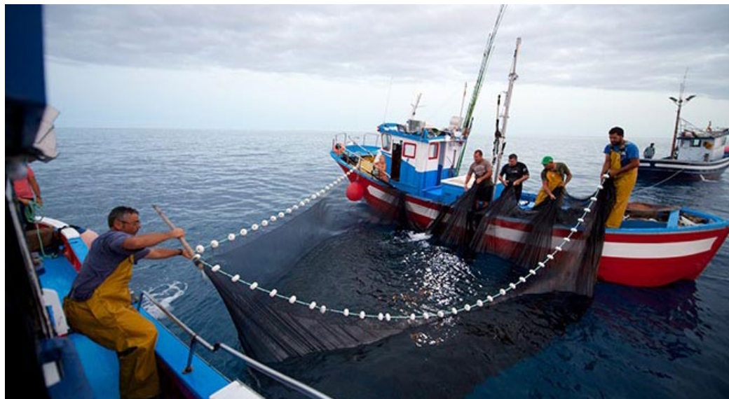
Plan de Gestión Integral de la Pesca Artesanal en Fuerteventura. Proyecto participativo de cogestión entre la World Wild Fund for Nature Canarias y los pescadores artesanales de Fuerteventura, con el objetivo de lograr una pesca sostenible y respetuosa con el medio ambiente (Carlos de Saá)