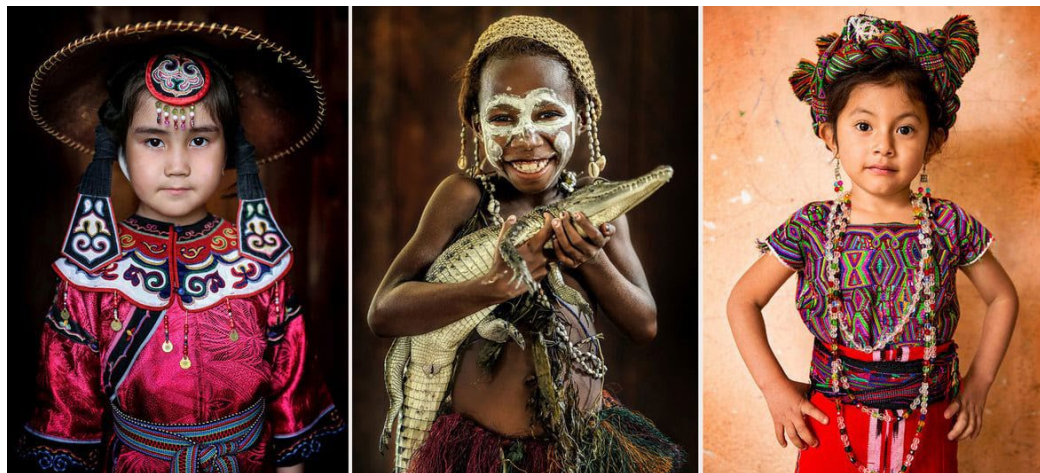
The World in faces. Proyecto del fotógrafo siberiano-australiano Alexander Khimushin, con el que documenta minorías étnicas para sensibilizar sobre sus problemáticas y defender su derecho a decidir respecto a su patrimonio cultural (Alexander Khimushin)

referencia, puesto que no deben ser las prácticas culturales las que determinen la identidad de los pueblos, sino todo lo contrario, que los pueblos y comunidades sean quienes definan su propia identidad y su sentido de pertenencia, a través de sus manifestaciones y expresiones culturales. Pues es precisamente a través de lo que entendemos por PCI —el conjunto de conocimientos, saberes, prácticas y manifestaciones culturales, transmitidas, vivas y continuamente recreadas por las comunidades que le dieron forma en función de los nuevos contextos sociales y naturales—, que las comunidades y los grupos pueden expresar su particular concepción del mundo, generando un sentimiento de pertenencia y continuidad, que es, al mismo tiempo, factor de creación cultural y de diversidad.