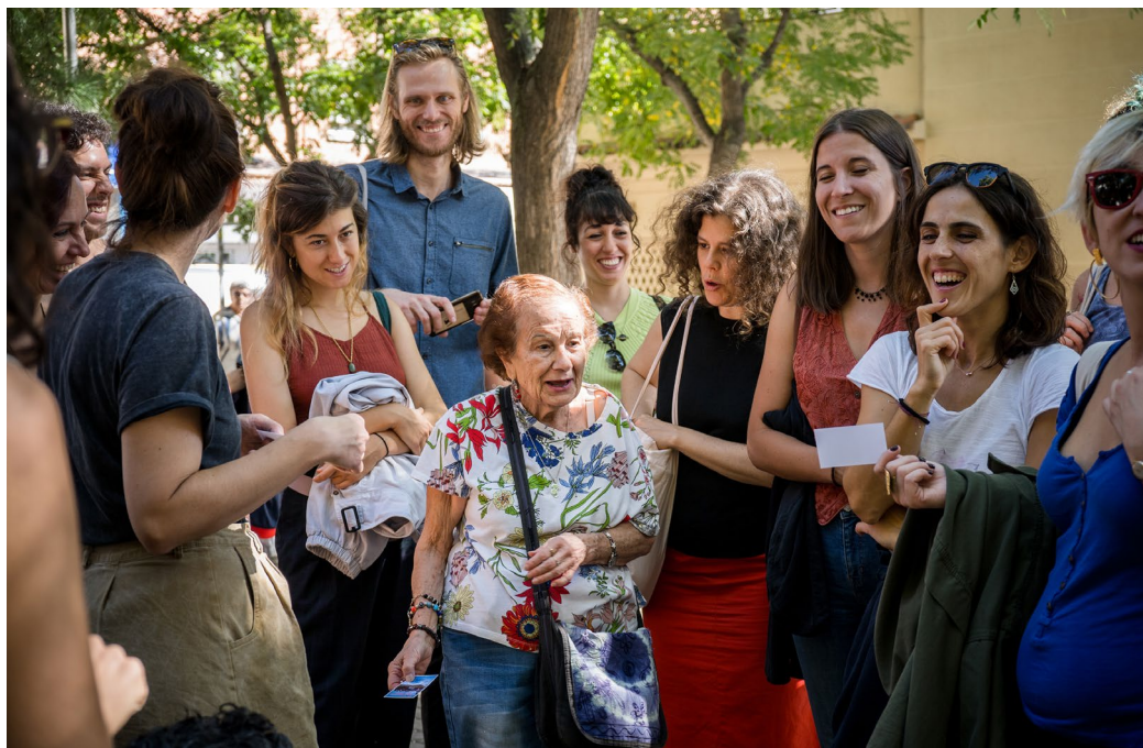
Recorridos Urbanos realizados por La Liminal. Colectivo de mediación cultural que surge de la necesidad de cuestionar los discursos hegemónicos en torno a los espacios urbanos y su historia

su protección. No obstante, no podemos perder de vista que el PCI es un patrimonio con características muy particulares, como hemos visto en apartados anteriores, y que, por lo tanto, requiere de medidas de salvaguarda específicas, que no siempre resultan de fácil implantación.